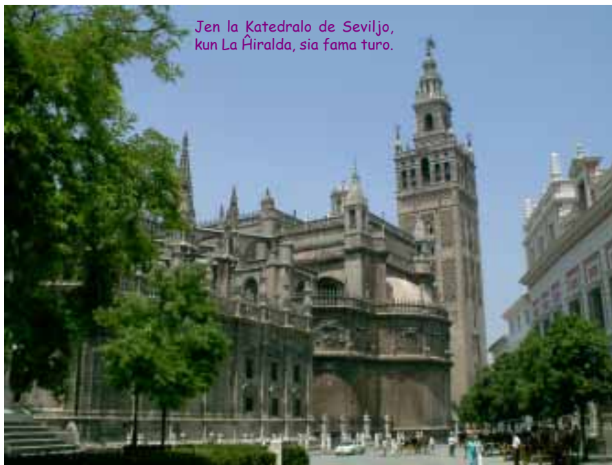
Jen la Katedralo de Seviljo, kun La Ĝiralda, sia fama turo.

Jen malgranda Manlibro de Ekskomunikotanto , kun ideoj, por ke vi uzu ilin. Kaj se vi