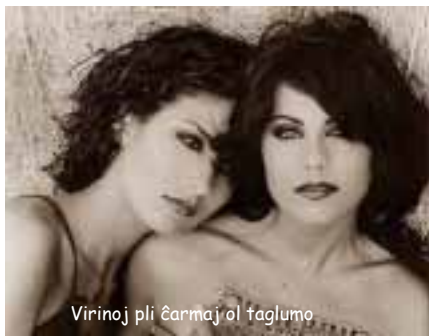
Virinoj pli ĉarmaj ol taglumo

homa, sentime kaj senespere forgesu viajn diojn kaj viajn religiojn ankaŭ: neniu el ili estas bonaĵ por io ajn, sed bataligi homon al homo, kaj la sola mencio de tiuj hororoj jam kaŭzis pli grandan pardonon da vivo en la tero ol ĉiuj aliaj militoj kaj plagoj kombinitaj. Rezignu la ideon pri alia mondo: estas neniu; sed ne rezignu la plezuron esti feliĉa kaj feliĉigi en tiu ĉi mondo. Naturo ofertas vin neniu alian manieron duobligi vian ekzistadon, daŭrigi ĝin. — Amiko mia, voluptaj plezuroj estis pli karaj al mi ol iu ajn alia. Mi idoligis ilin laŭ mia tuta vivo, kaj mia deziro estis fini ĝin en ĝia sino; mia fino alproksimiĝas, ses virinoj pli ĉarmaj ol taglumo atendas en la apuda ĉambro. Mi rezervis ilin por tiu ĉi momento: foriru,